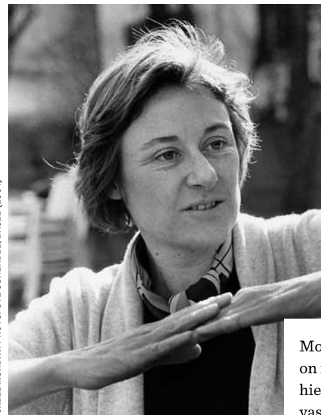
ISABEL MUNDRY. PHOTO: UTE SCHEDEL, BASEL (2004)