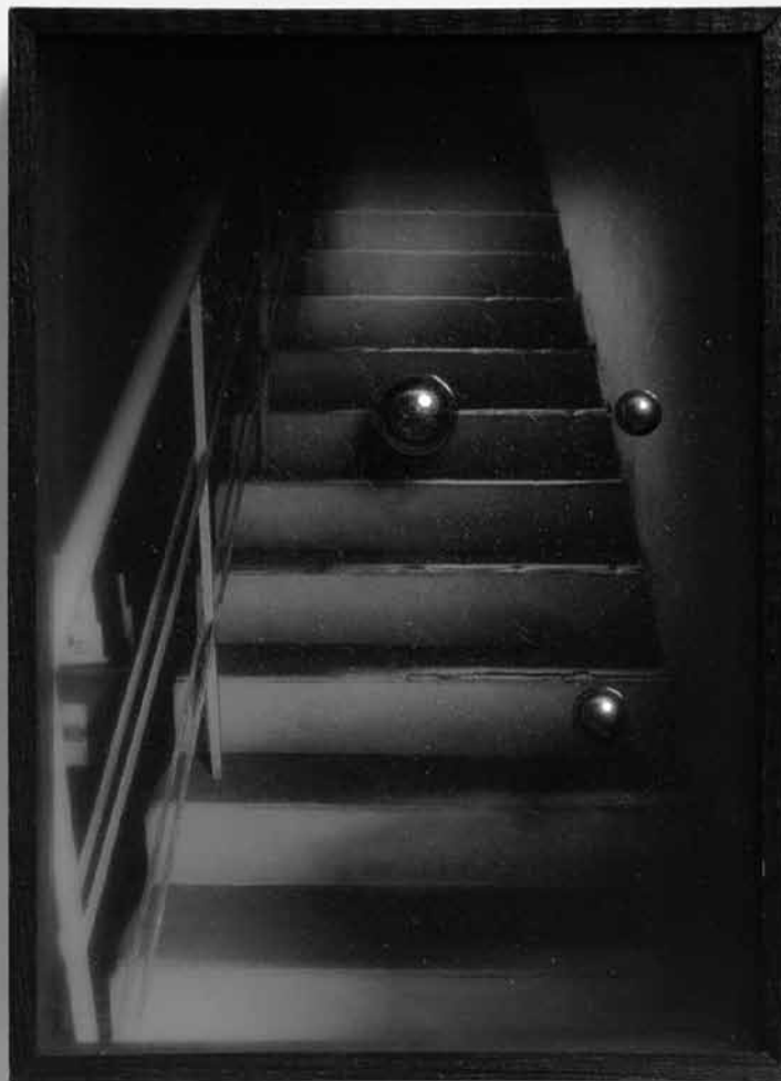
KUGELOBJEKTII, 1970

Vapaa pääsy / Free entrance Lisätiedot / For more information visit www.musicanova.fi