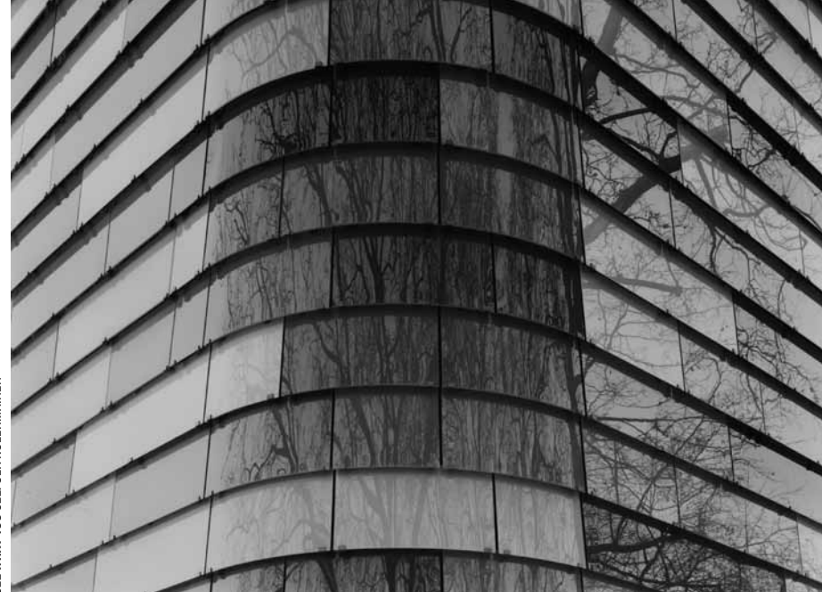
SEE WHAT YOU SEE: OLA KOLEHMAINEN

Liput / Tickets: 10 / 7 € Lippupiste (alkaen / from 2.1.2011)